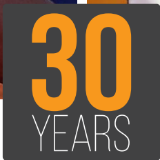
Novosti iz programa pratite putem službene web stranice turnira www.croatiaopen.hr .